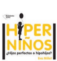
Consecuencias de la hiperpaternidad en la infancia y la adolescencia

dels més petits, sobre hiperactivitat, sobre jocs a l'aire lliure, tecnologies i pantalles, feminisme, noves masculinitats i alguns, fins i tot, parlen del nou sistema educatiu per entendre com aprenen a l'escola. Recordem: no hi ha cap llibre d'instruccions. Cadascú ho fa com pot, però esperem que aquests suggeriments facin que el camí sigui, com a mínim, una mica més senzill.