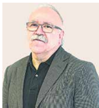
Josep Lluís Carod-Rovira.