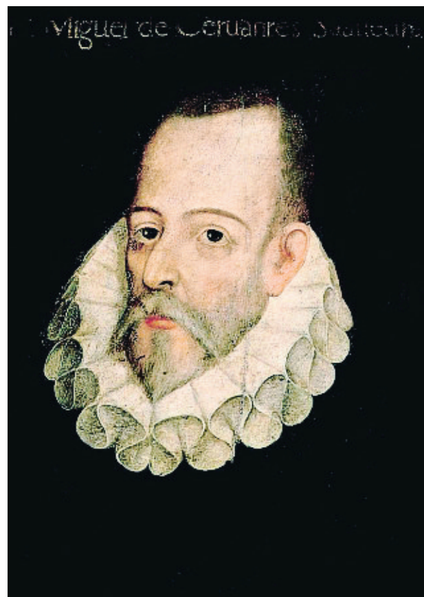
Retrat de Miguel de Cervantes

el 1235, però la realitat és que es va inventar encara no fa dues dècades. Tant li fa. Val per la remota edat mitja o moderna -sobre la qual, per cert, aquí s'aprèn un munt-, val fins i tot per a la contemporaneïtat. Si per defensar que autoritats catalanes van espoliar Sixena es repeteix que una milícia d'anarquistes que venien de Barcelona van cremar